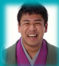
桂 米朝一門 四代目 桂 米紫