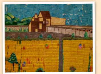
若山荘短時間デイ「島本の田園」

ふれあいランドステージでは踊りや演奏など出演いただき楽しいひと時を過ごすことができました。