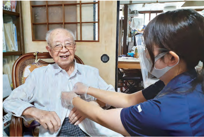
着脱介助(ボタン付け)

支援や介護を必要とする方のご自宅に訪問し、掃除、洗濯、調理などの家事支援や排せつ介助、入浴介助などの身体的な支援を行っています。