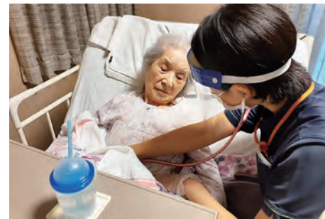
聴診器(お腹の動きを聞きます)